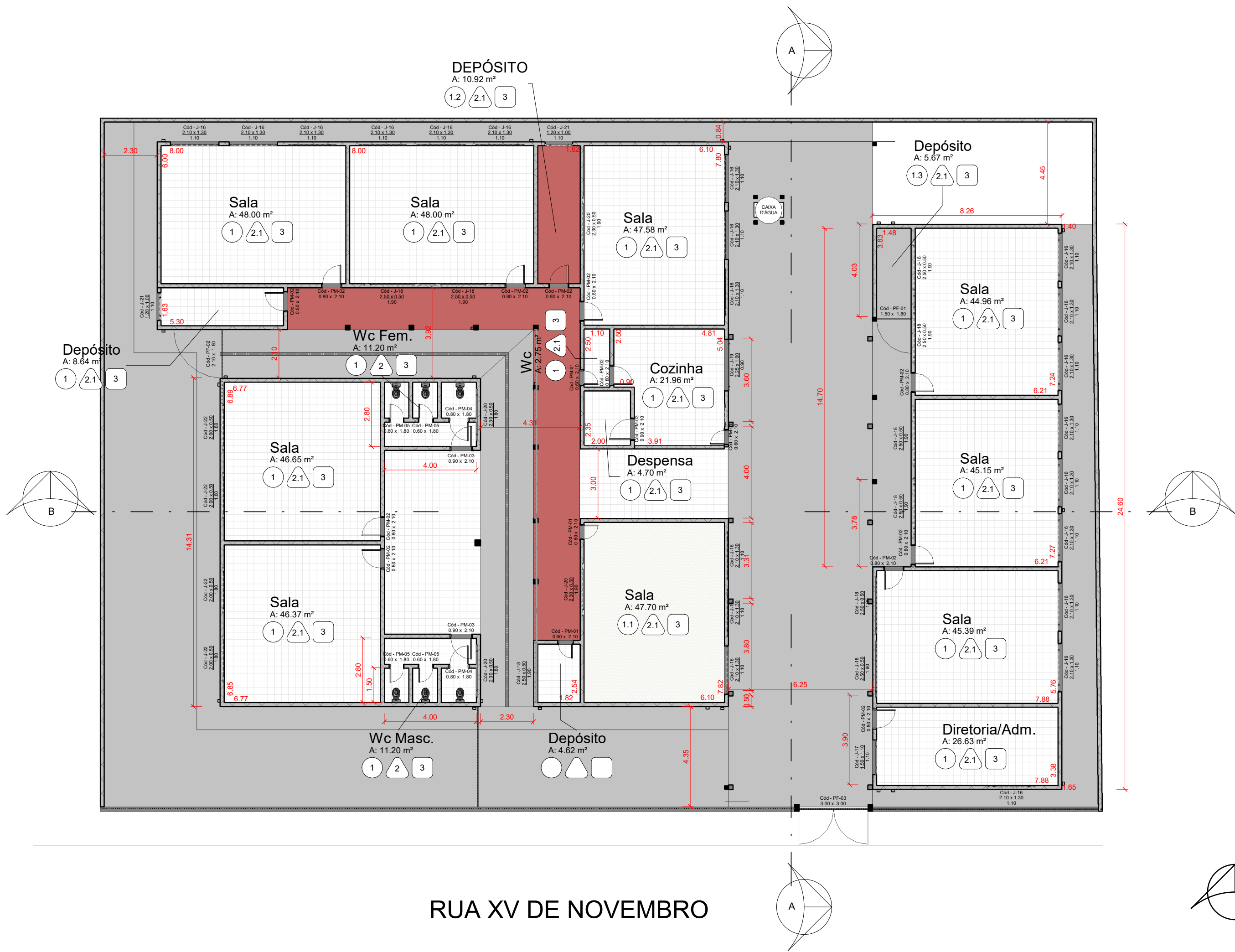
EXISTENTE - PLANTA BAIXA 1 : 150